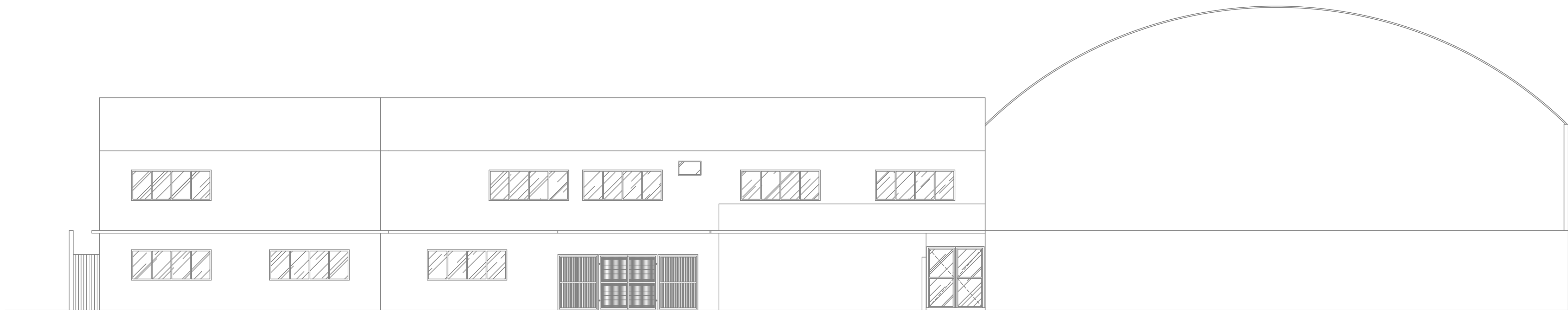
10 FACHADA Escala: 1/100